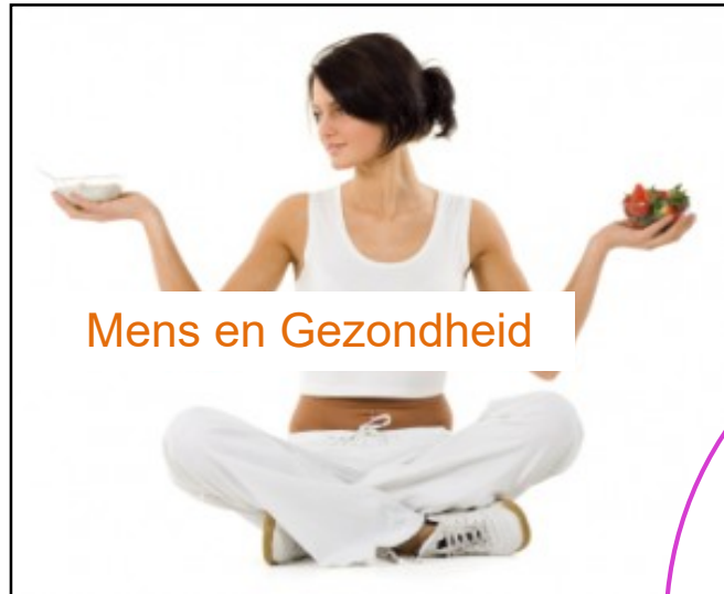
Mens en Gezondheid