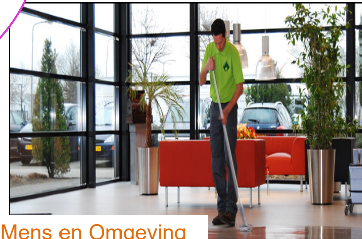
Mens en Omgeving