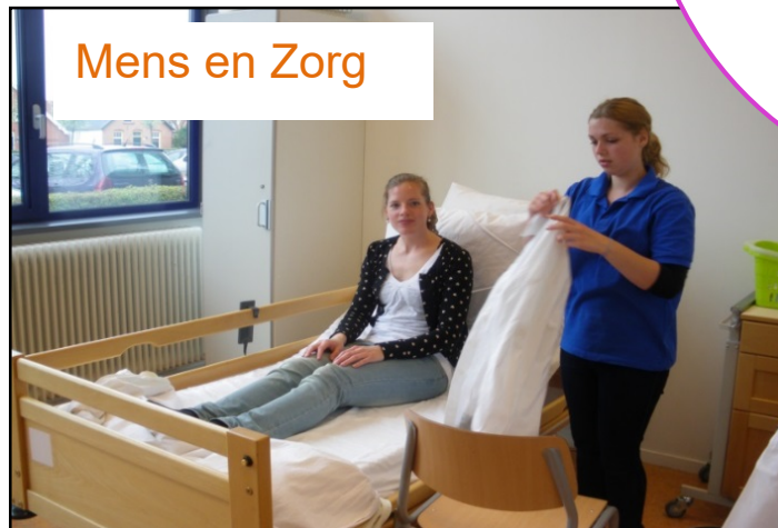
Mens en Zorg