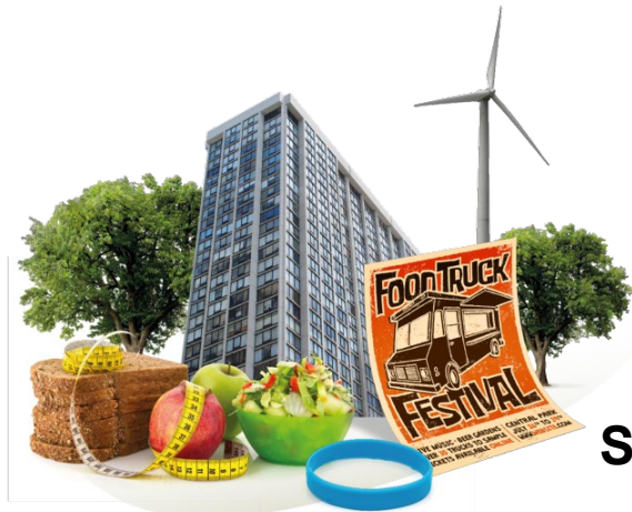
Stad en mens